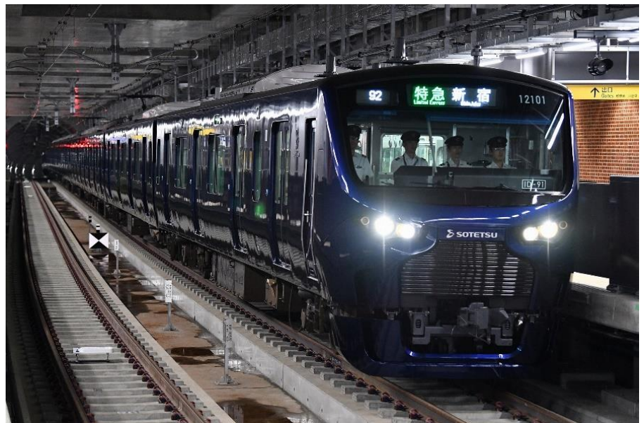
相鉄・JR直通線用の新型車両「12000系」